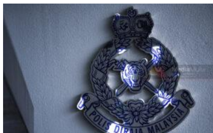
Warga emas tidak sedarkan diri, anak ditemui tergantung 22 Mei 2022, 10:28 pm