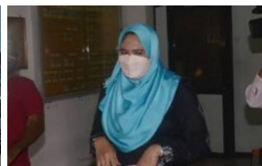
Guru mengaku tidak salah dapatkan suapan melalui...