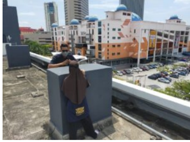
Polis selamat wanita murung cuba terjun 22 Mei 2022, 10:20 pm