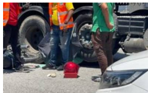
Ceria sambut hari raya di sekolah sebelum maut...