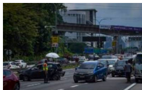
Jalan raya Malaysia ibarat medan perang