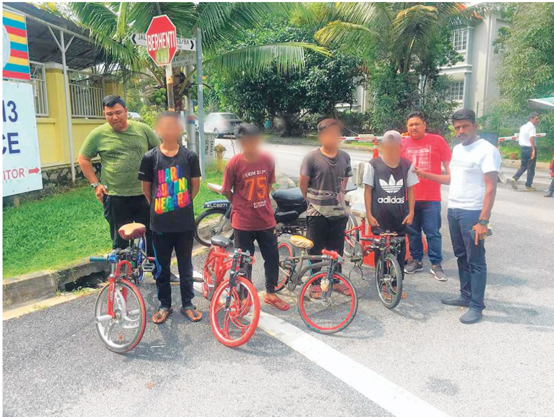
Isu kanak-kanak dan remaja terlibat dalam aktiviti basikal lajak perlu ditangani secara holistik bukan hanya hukuman semata-mata. – GAMBAR HIASAN