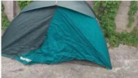
Pemilik dikecam sewakan khemah di lantai konkrit rumah berharga RM328 semalaman 22 Mei 2022, 10:00 pm