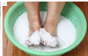
Hilangkan sakit sendi buat selama-lamanya! Bacalah ia!