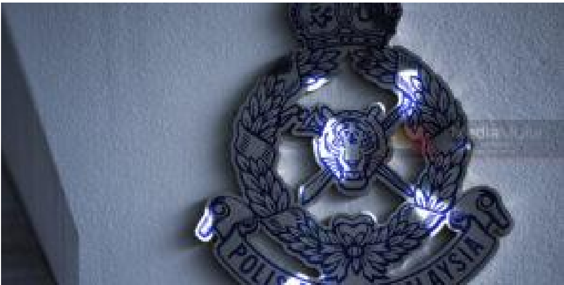
Warga emas tidak sedarkan diri, anak ditemui tergantung 22 Mei 2022, 10:28 pm