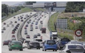
Jangan pandu lorong kanan kalau perlahan