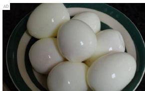
Cara mengelakkan serangan jantung. Lakukan sekali...